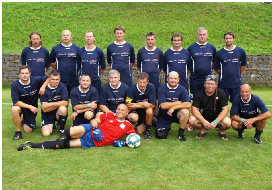
FC Beňov – starší páni