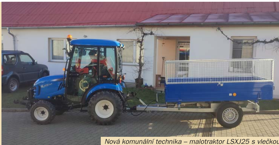
Nová komunální technika – malotraktor LSXJ25 s vlečkou

ce 2 100 000 Kč. Rozpočet byl schválen jako vyrovnaný. Součástí rozpočtu je i příspěvek na provoz příspěvkové organizace Základní školy a Mateřské školy Beňov v částce 1 500 000 Kč. Obecní zastupitelstvo schválilo neinvestiční finanční dotaci pro spolky obce v celkové výši 354 000 Kč takto: