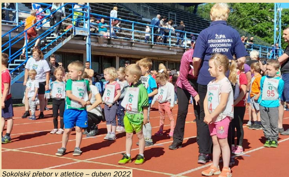
Sokolský přebor v atletice – duben 2022