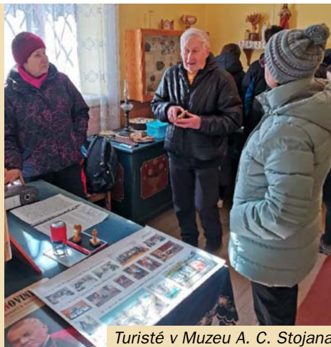
Turisté v Muzeu A. C. Stojana