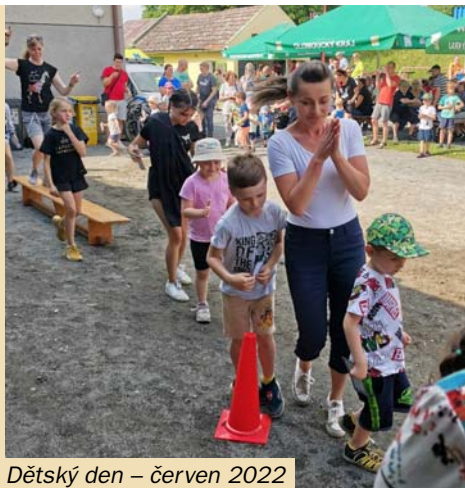
Dětský den – červen 2022

Změna termínu je výhradním rozhodnutím jednotlivých pořadatelů!