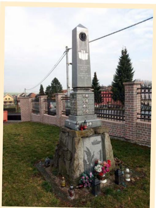
V roce 2023 proběhne oprava pomníku z I. světové války na hřbitově