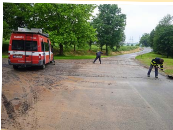
Škody po přívalových deštích 4. a 13. června 2022